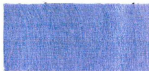
067 RIVER BLUE