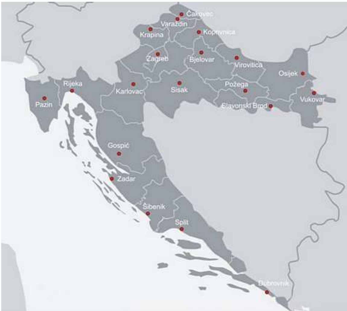
Mapa de la Agencia para la Promoción de las Inversiones y del Comercio (Croinvest).